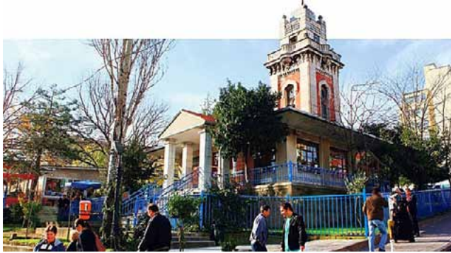
Resim 7. Kule.