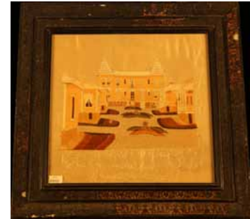
Resim 5. Merkez Bina ve Pavyonları Gösteren İşleme Tablo. Açık mavi renkli atlas üzerine kahverengi, tarçın, bej, nefti renkli ipek iplikle sarma, kordon tutturma, hav işi ile işlenmiştir. 19. Yy. Sonu, Dolmabahçe Sarayı Müzesi Koleksiyonu, E.N.12-2780