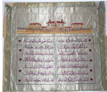
Resim 4. Merkez Bina ve Pavyonları Gösteren İşleme Pano. Mavi atlas üzerine çeşitli ipekli ipliklerle sarma ve balıksırtı ipekli ipliklerle işlenmiştir. Altında bulunan şiir padişaha övgüdür. 19. Yy. Sonu, Topkapı Sarayı Müzesi Koleksiyonu, E.N.31-1593