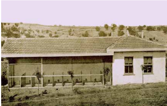
Resim 6b. Ahırlar.