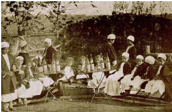
Resim 6c. Maden Suyu İçen Çocuklar .

Padişah'ın özel ilgisi ve Dr. İbrahim Bey'in çalışmaları sonucunda hastane hızlı bir gelişim göstermiştir. Yeni binalar eklenmiş, 1900'de yeni bir poliklinik, 1902'de 22 yataklı cerrahi pavyonu, kütüphane ile fotoğraf atölyesi açılmıştır. Ardından röntgen ünitesi faaliyete geçmiş, ilk röntgen cihazlarından biri kullanılmıştır. 1903'de modern araçlarla donatılmış olan fizikotedavi bölümü hizmete girmiştir. Çocukların jimnastik yapmaları için ayrı bir bölüm de yapılmıştır. Kızıl ve kuşpalazı serumlarıyla çiçek aşısı üretmek için laboratuvar kurulmuş, bu amaçla Bursa'dan atlar getirilmiştir. Çocukların yemekleri iyi aşçılar tarafından hazırlanmış ve yiyecekler hastanenin kimyahanesinde tetkik ettirilmiştir. Çocukların taze süt içmeleri için inek ahır yapılmıştır. Yine çocuklara şifa sağlayacağı düşüncesiyle Padişah Karahisar maden suyunu hastaneye vakfetmiştir. Karahisar'dan maden suları trenlerle hastaneye taşınmıştır ( Resim 6a-c ).