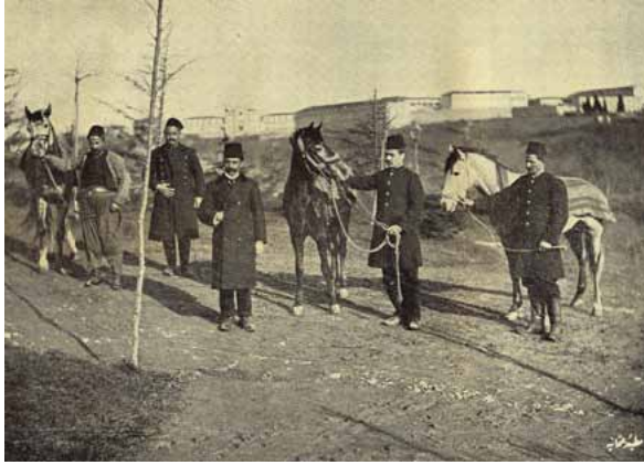
Resim 6a. Aşı için Getirilen Atlar.

Hastanenin yapımı ve açılışından sonra da tüm masraflar Padişah tarafından karşılanmıştır. Hastanenin eczanesinde kullanılacak olan tüm ecza kapları Yıldız Sarayı'nın bahçesinde bulunan çini fabrikasında özel olarak üretilmiştir. Hastanede kullanılacak birçok mobilya ve tıbbi araç Almanya ve Fransa'dan tedarik edilmiş, çocukların bakımı için Almanya'dan hemşireler getirilmiştir 3 . Hastane hekimlerinin çoğu Almanya, Paris, Viyana ve Gülhane'de ihtisas yapmış doktorlardan oluşmaktadır.