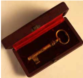
Resim 3. Padişaha Sunulan Hastanenin Anahtarı ve Altın Yıldızlı Kadife Kutu, 1899. Topkapı Sarayı Müzesi Koleksiyonu, E.N.39-2103