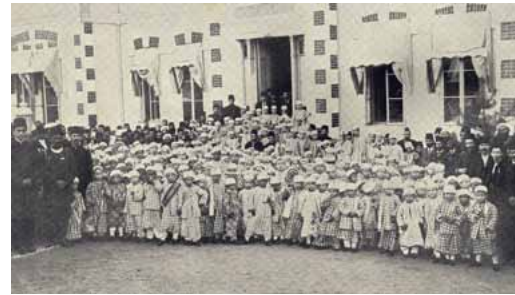
Resim 2. Hastane Açılışında Sünnet Ettirilen Çocuklar.